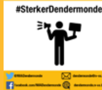
#SterkerDendermonde: cultuurbeleid p. 4 – 5