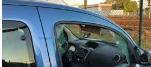
Geen camera's in stationsbuurt p. 2