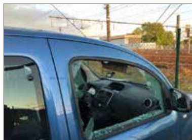
▲ De trein- en busreizigers en de bewoners uit de stationsomgeving van Dendermonde verdienen beter.

Het regent meldingen van reizigers en bewoners uit de nabije straten over vandalisme op auto's, bromfietsen en fietsen. N-VA Dendermonde herhaalde daarop haar vraag om camera's te plaatsen aan het station van Dendermonde. Het is niet logisch dat openbaar vervoer én ons station worden gepromoot, maar dat het parkeren van je auto of fiets op een veilige manier