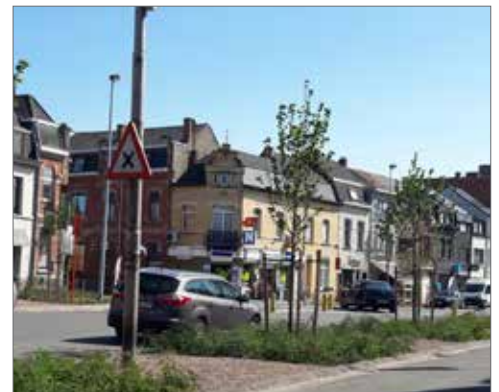
▲ Op de Oude Vest zullen nog meer parkeerplaatsen verdwijnen.

“Een parkeergebouw met één verdieping is onvoldoende, want er zullen de komende jaren mogelijk parkeerplaatsen verdwijnen op de Gedempte Dender en de Oude Vest. Door slechts één verdieping te bouwen, komt de meerderheid terug op haar belofte om elke verdwenen parkeerplaats te vervangen door een andere. De N-VA pleit er dan ook voor om onmiddellijk een tweede verdieping op het parkeergebouw te voorzien.”