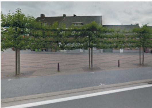
▲ 't Zand

In de Heidestraat is er na overleg met de bewoners een proefopstelling goedgekeurd om de parkeerproblematiek aan te pakken en de verkeersveiligheid te verbeteren. De eerste fietsstraat in Appels is een feit.