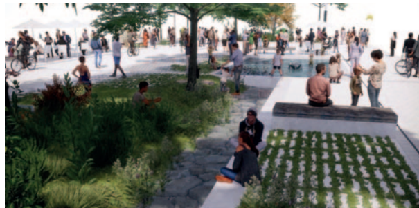
▲ Oude Vest