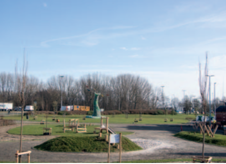
▲ Groene Dender