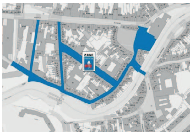
▲ Fietszone Centrum-Zuid