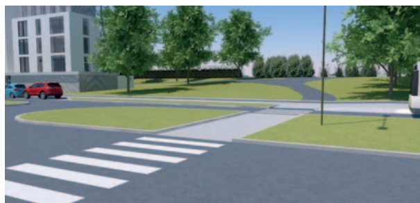
▲ De Bruynkaai