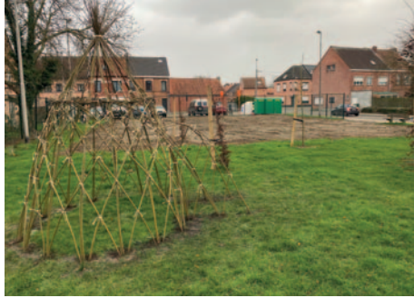
▲ Camille Marchantplein