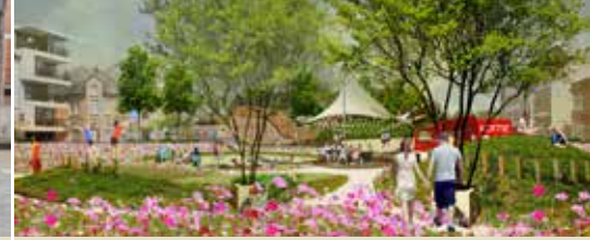
Groene plannen voor Gedempte Dender (p. 3)