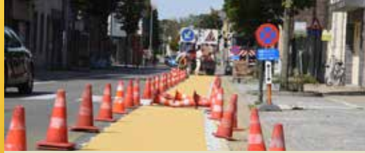
Op naar een verkeersveilig Dendermonde! (p. 2)