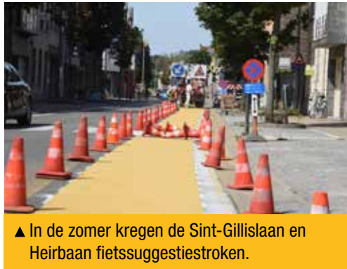
▲ In de zomer kregen de Sint-Gillislaan en Heirbaan fietssuggestiestroken.

Momenteel maken we werk van een fietssnelweg tussen Sint-Gillis en Schoonaarde en van nieuwe, vrij liggende fietspaden op het kruispunt met de N41 en de Denstraat. De N-VA dankt alle inwoners voor hun begrip en geduld tijdens de werken.