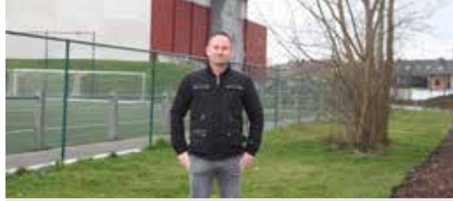
Sportbeleid faalt p. 2