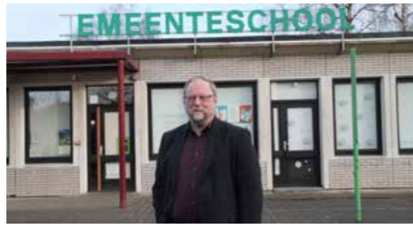
De ‘afvallige’ letters op het gebouw van de Freinet-school in Appels zijn tekenend voor het onderwijsbeleid in Dendermonde.

Dat de bevoegde schepen (CD&V) er niets van bakt, bleek in juli al. Toen moest de bespreking van het schoolreglement van de agenda van de gemeenteraad verwijderd worden omdat het niet beantwoordde aan de decretale verplichtingen. In september werd het schoolreglement drie maanden te laat opnieuw voorgelegd. In december wilde de schepen de kostenbijdrage in de loop van het schooljaar wijzigen en daardoor rechtstreeks ingaan tegen het decreet basisonderwijs. In januari legde ze een document voor waardoor er volgend schooljaar in de